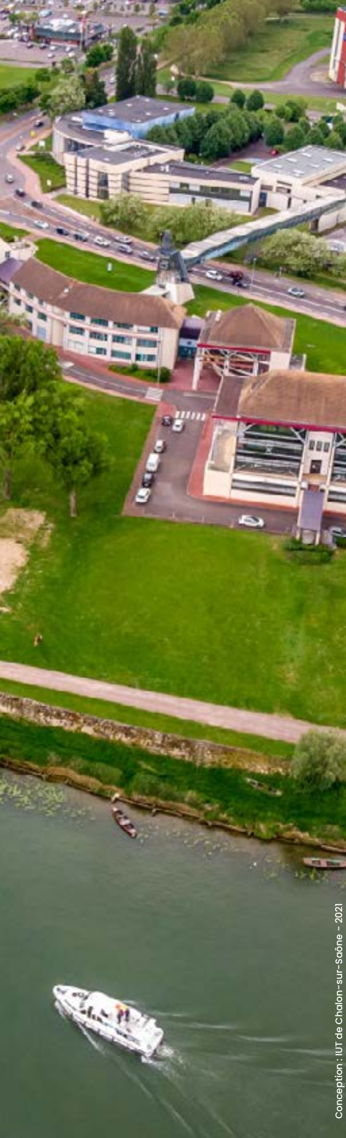
Conception : IUT de Chalon-sur-Saône - 2021